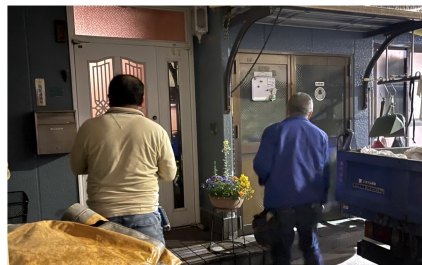
宮本委員長(左)も積極的に訪問