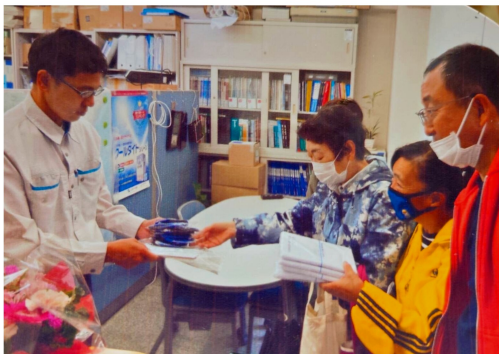
事業所訪問は日中を中心に

ながら先が見えない状況です。さくら分会の目標も10人と気が遠くなる数です。分会内に事業所が多い特徴を持ちますが、夜間の訪問行動ではなかなか会うことができません。それでも初日から訪問行動を行い、住宅デーや新入学祝金を会話のきっかけにしています。訪問グッズのマスクは皆さんに喜ばれています。