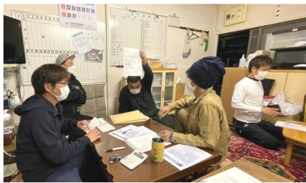
加入書頂きました！