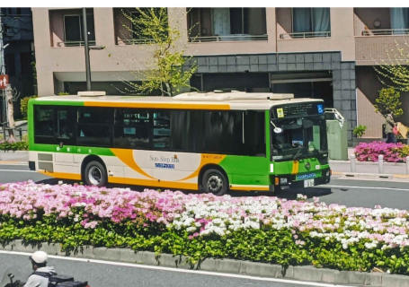
来年も綺麗に咲きますように

今月の1枚 西巣鴨町づくりの会が豊島区や東京都などに対して、住民やこの地を訪れた人々が楽しく歩ける町にしたいと声をあげ、行動して実現した植樹帯です。 設置には申請手続きに何年も掛かり、住民の希望したつじの植樹帯がやっとの思いで完成したものです。 今年も綺麗に咲いてくれました。【さくら・鶴崎鋭治郎】