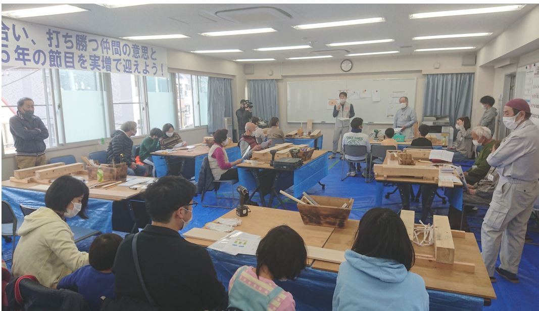
各テーブルに腕利きの職人を配置

【文・宮本卓廣】今年度(日)に開催しました。も昨年に引き続き新型コロナウイルスの感染拡大が広がり、組合運動の制限を余儀なくされました。その中でも豊島支部では、地域貢献・交流を目的に「DIYイベント」を12月12日(日)に開催しました。7月に開催して好評だった「おうちでDIY巣箱づくり」のイベントを区民向けに案内しました。午前は部材の切り出しに加え、木材や道具についての座学を取り入れ、子ども