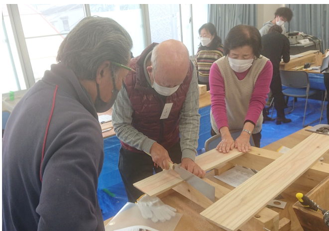
ご夫婦での共同作業にほのほの

大人14人・子ども9人の合計23人・9組の参加となりました。参加者数に合わせて、当日の講師も、ベテランの木工組合員と若手の後継者世代組合員を9組のチームを編成して対応しました。