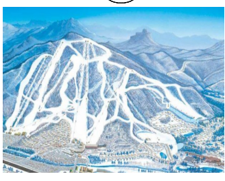
多彩なコースと3つのパーク