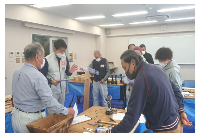
講師陣も入念な打合せ