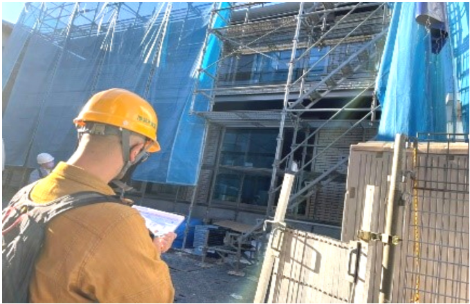
開口部は入念にチェックします