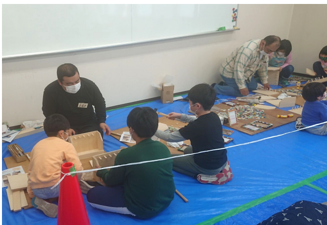
将来は大工になって組合に加入してね