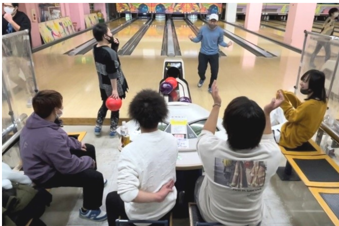
青年部のイベントは楽しいぞ～

ここ数年間、青年部は結果部員が少なく、新型コロナウイルスの影響も相まって思うような活動ができていませんでした。それでも地道な活動を続け、本年度より徐々に結果部員を増え、今回の忘年会イベントを開催できました。