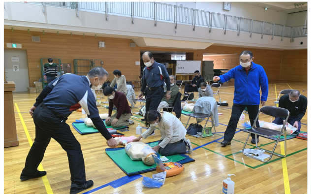
いざという時のため訓練も真剣に

以前この講習を受けて『上級救命技能認定書』を持っていた私の先輩から「過去に1度だけではあるが、家の前の道で人が倒れていた時にこの経験が役に立ち、人を助ける事ができた」と聞いた事があります。