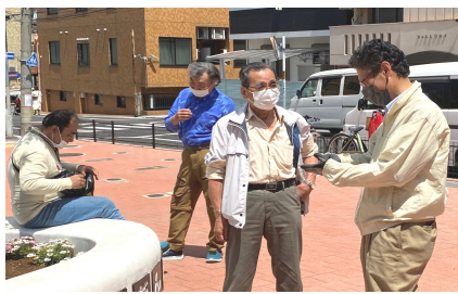
日曜行動にて (上池袋本町)

5月2日に6人が池本だん公園に集まり拡大行動を行いました。直接公園に集まることで、密を避け、すぐに行動することができました。