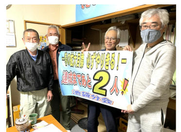
分会役員で団結 (池袋)

拡大目標の達成に向け、今いる対象者を早急にあたり、最後まで団結して取り組んでいきます。