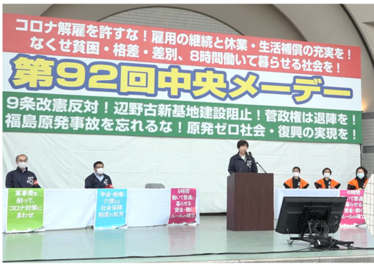
代々木公園野外ステージ