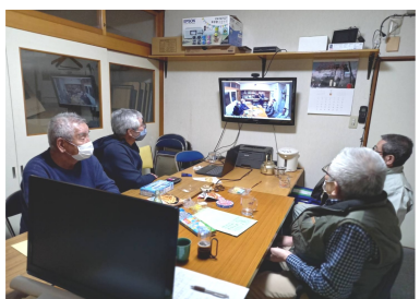
テレビをモニターとして活用

は、分会センターに15年ほど前からパソコンを設置していたことです。利用目的としては、分会の会計を毎月入力を行い、センターに集まった時に誰でも財政状況を確認できるようにするためです。