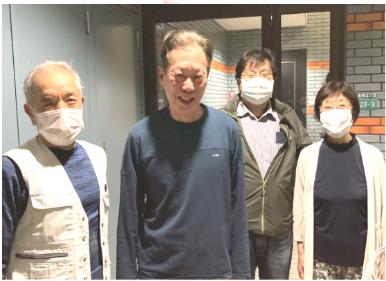
第4次行動で見事達成 (さくら)

5月12日、第4次行動2日目の行動は、前半に分執を行い、午後8時過ぎより有力対象者への訪問行動を行いました。1件目の対象者は、他支部の組合員であることが訪問中の対話で判明し、地元の豊島支部へ移動してくれることになりました。2件目は元組合員で、組合への再加入を勧めに前夜に続いて2度目の訪問でした。仲間の熱心な勧めに、経済的な事情から長く続けられるかは分からないがと加入を決め、翌日に支部へ加入申込書を届けに来てくれました。10人の拡大目標は達成しましたが、まだ対象者はいます。さくら分会は、超過達成を目指して、拡大運動を止めずに邁進します。