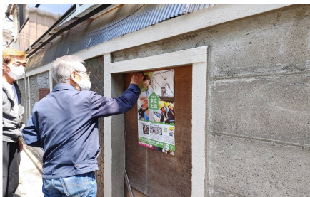
4/25 (日) の宣伝行動 (南池袋)

現在は対象者はいませんが、センターが密にならないよう班分けし、達成に向けて最後まで事業所訪問を継続します。