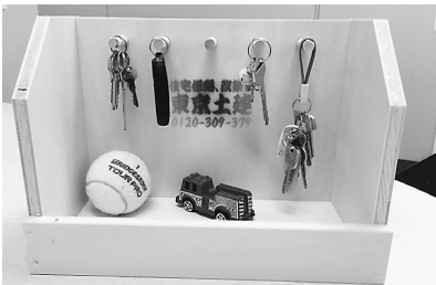
工作キッドを300セット無料配布

新型コロナウイルス感染症の影響により住宅デ―などの様々なイベントが中止になる中、建設組合として、子どもたちを対象にした木工教室が出来ないかと色々と試行錯誤し、動画配信での木工教室を考えました。この