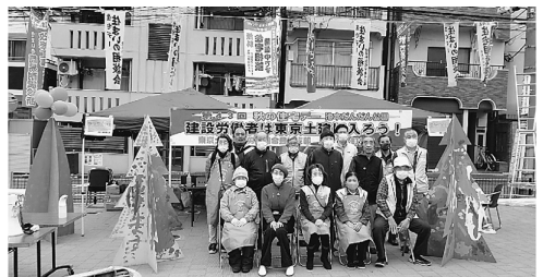
参加した分会の仲間

一番で包丁50本の受付となり予想以上の大盛況となりました。 今回は感染防止のため木工教室が出来ないため、子どもたちには風船をあげました。自分たちでも膨らませて、とても喜んでいました。 反省会では、いくつかの課題もできました。ぜひまた開催したいと思えます。