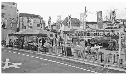
土建への加入を訴える

上池袋本町分会では、11月29日(日)、池本だんだん公園にて「包丁研ぎ住宅相談」を行いました。分会では今年2回目の取り組みとなりました。組合員は18名が参加(練馬支部や他分会の仲間も参加)、天候にも恵まれ、