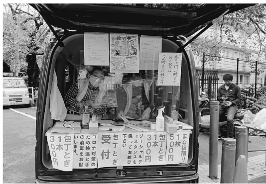
車の荷台での受付

の思いの中、10月11日 いつもなら、焼きそば(日)「住宅デー・包丁・木工コーナーの準備を