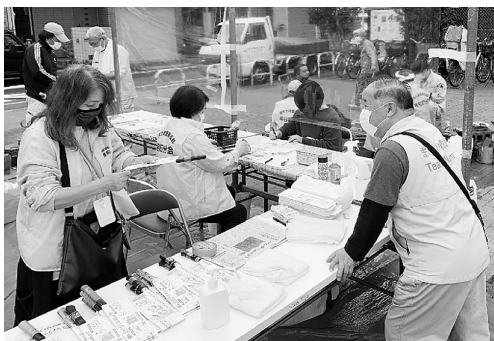
コロナ対策をして受付

密にならないよう 取り組みました。 検温、消毒にそれぞれ役員を配置、 一方通行になるよ うに動線を確認し ました。受付では 透明フィルムで飛 沫対策を徹底しま した。