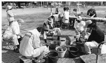
分會のユニフォームを着て包丁研ぎ

例年の住宅デーに比べ、大幅な縮小を余儀なくされた中においては、まずまずの結果になったと思います。序盤はなかなか来場者が増えず焦りましたが、チラシなどを見てきた人やたまたま公園を利用して人が一