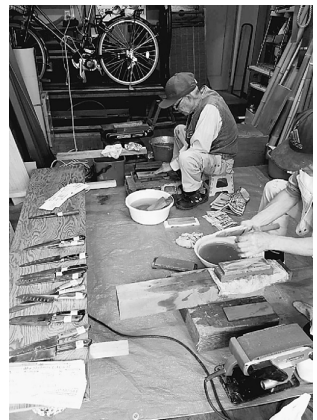
作業場での包丁研ぎ

役会議でテントやブルシートを使用しない方法はないか、受付はどこにするか、研ぎ物はどこにするか、アイデアや意見を出し合いました。