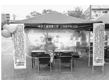
住宅相談も感染予防を万全に

協力で開催しました。事前の準備でハガキでの案内とチラシ1000枚 「子ども工作」はなかったで自宅でも楽しんでもらうための「おみやげ(コッパティ&クリスマスツリー)」を用意しました。一日天気に恵まれ200人の来場者を迎え大盛況で終了しました。