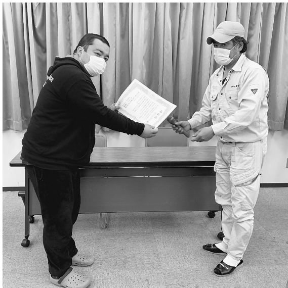
椎名町分会、拡大率・拡大数でトップ!

9月と10月の2か月間におよぶ秋の仲間づくり運動は、支部・分会役員を先頭に全分会の仲間・家族のみならず奮闘しました。コロナ禍の中、仲間の状況を聞き取る運動をすすめ、101人(拡大率4・73%)の新たな仲間を迎え、本・支部の月間目標を突破すると同時に、11月1日人員を2,104人とし、13年連続で全分会目標達成を勝ち取るとりくみとなりました。また、青年部・豊寿クラブ・女性の会も目標を達成しました。みなさんのご協力にあらためて、お礼を申し上げます。