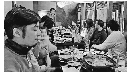
エアロビ後の交流会で盛り上がる!

イベントをやってほしいと言った声も聞かれました。今回のとりくみを活かし、今後も若手が参加しやすいイベントを企画していきます。