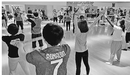
音楽に合わせて約一時間、汗を流す

紹介もおこない、初めて参加した仲間も年齢や仕事を越えてさまざまな交流がありました。今回参加された組合員のほとんどの方からまたスポーツ