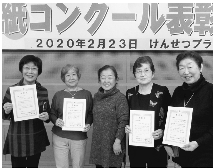
表彰された仲間のみなさん