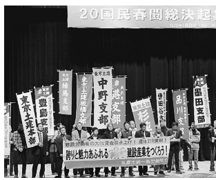
東京土建の決意表明

国民春闘勝利総決起集会が1月29日中野ゼロホールで開催され、2020年の春闘がスタートしました。豊島支部からは11人が参加しました。 壇上で「この20年、賃金が上がらず、3回目の消費税増税があった。一方、大企業は内部留保をため込んでいる。要求を掲げて団結しよう」、「最低賃金の全国一律化・時給500円」、「お弁当が盗まれる」、「交通費は支給されない」などの発言には驚きました。人間として生きていくには時給1500円の必要性を感じました。