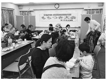
美味しいお餅や豚汁を食べ交流

1月26日(日)、支部会館で「新年もちつき大会」が開かれました。お手伝いの人達は8時前から集合、3階の会場作りや1階の車庫でのもちつき準備を行いました。雨の予報がはずれ、曇り空の中、予定どおり始まりました。 蒸し上がったもち米のいい香りがして、もちつき音の始まりです。もちつきのお餅を食べたり、手芸サークルの人達の協力で、ペットボトルのキヤップを利用したポプリ入りの帽子型飾りを作り楽しみました。