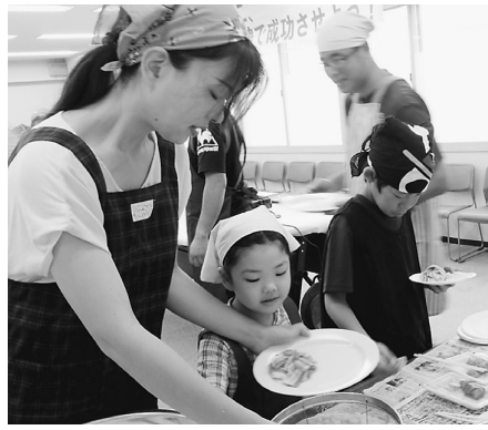
上手くできたかな？

て場のように飾られていて、それを眺めていても楽しかったです。各通路からいろいろな猫の俳優が登場し、物語は始まりました。猫のようなしなやでパワフルな踊りを見ていると次第に舞台に引きこまれていきました。いろいろな猫達が出てきて、それぞれの個性豊かな歌と踊りで、楽しいひと時を過ごすことができました。