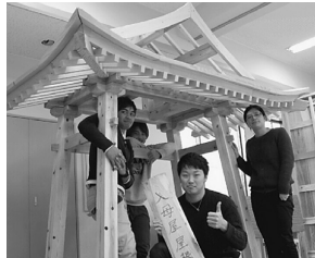
一生の思い出になる卒業制作