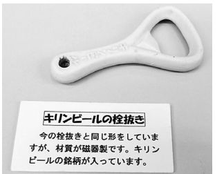
麒麟ビールの栓抜き 今の栓抜きと同じ形をしていますが、材質が磁器製です。麒麟ビールの銘柄が入っています。

絵画館(絵画館)があります。絵画館には当時の服装や宮中行事を知る手が。二宮尊徳像も銅像は