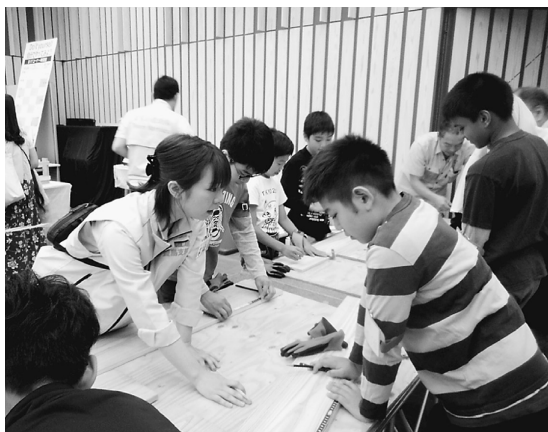
上級コースではスライド式本立て作成