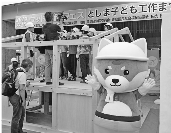
太郎くんも大活躍