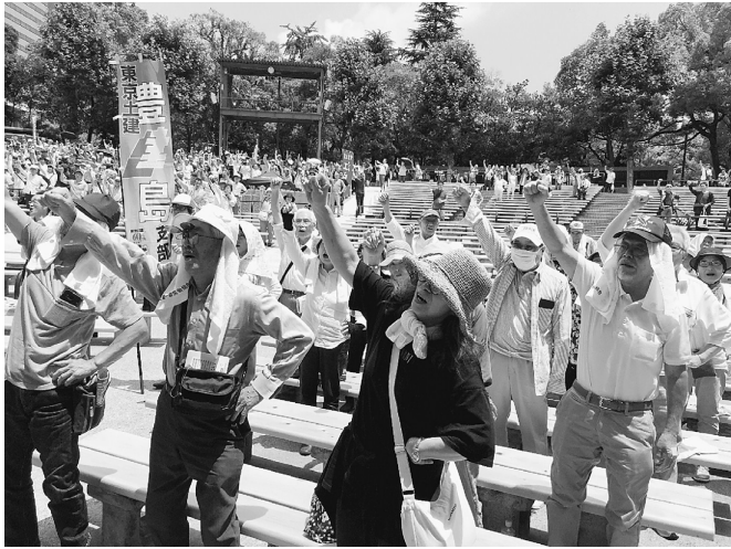
猛暑の中、土建国保の予算を勝ち取る！

発行所 東京土建一般労働組合 城北ブロック会議 東京都豊島区西池袋5-22-15 電話 豊島 (3986) 2471 北 (5390) 6021 板橋 (3963) 5325 練馬 (3825) 5522 発行人代表者 佐藤 広平 発行予定日 毎月4回 1日、9日、17日、25日