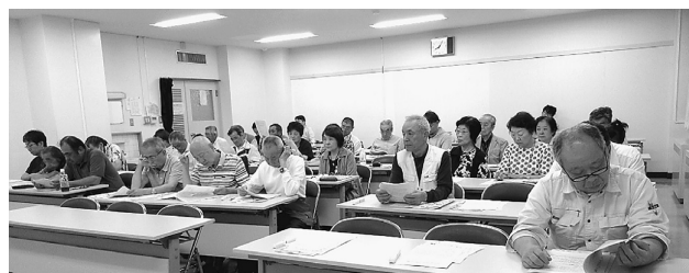
東部区民事務所での共済学習会