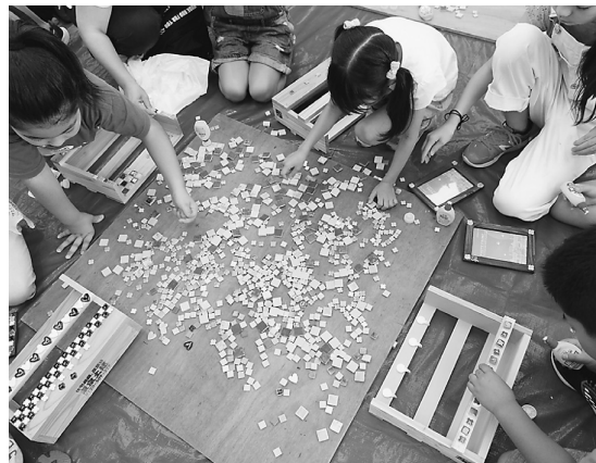
タイルアートも大盛況