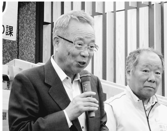
高野区長も参加しました