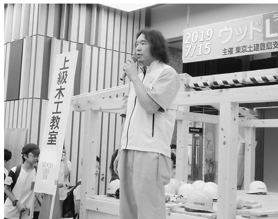
大浦責任者の開会宣言