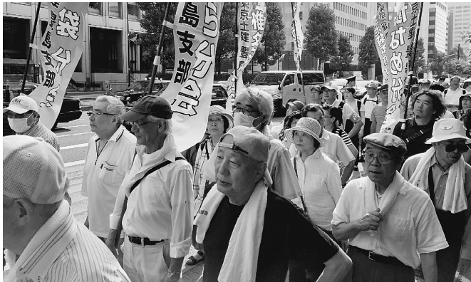
大きなシュプレヒコールで東京駅までデモ行進