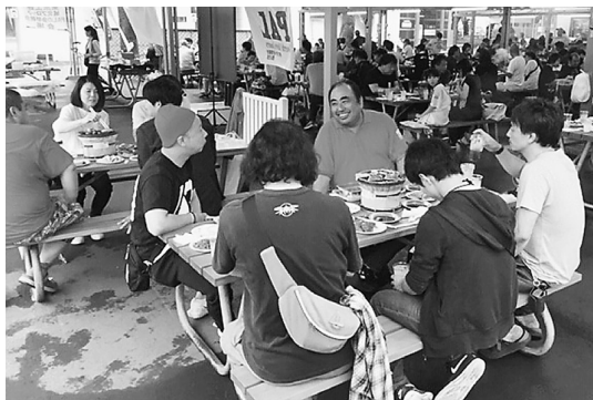
豊島支部41名参加、BBQ交流会

当日はあいにくの天気でしたが、参加者は元気いっぱいバーベキューを楽しみました。イベントに先立って丸の内3