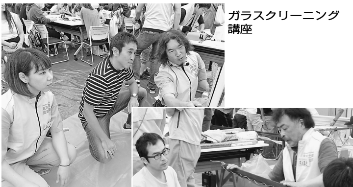
ガラスクリーニング講座