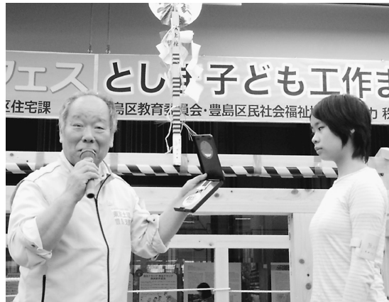
上級コース表彰式