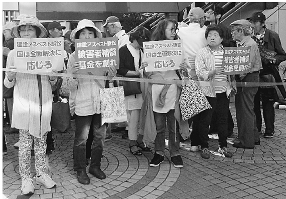
新宿駅での宣伝行動