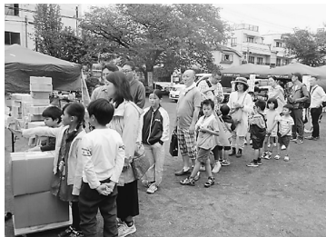
工作教室には長蛇の列

いまにも一降りありそうな曇天の9日(日)千葉県早稲田公園で、かなめ分会住宅デーが開かれました。会場に訪れた地