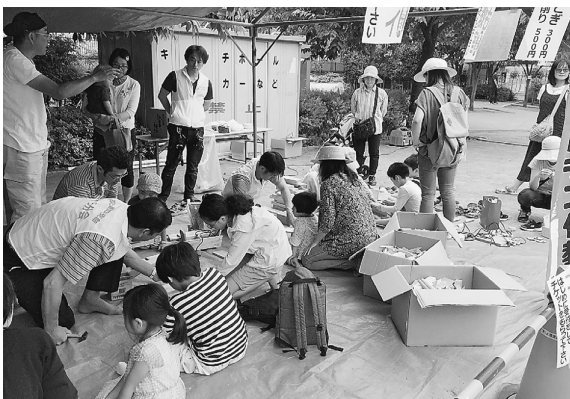
子ども工作、若手が大活躍

6月2日に開催された 第42回住宅デーは組合員 の奮闘もあり、素晴らしい ものになりました。椎 名町分会では事前に分会 実行委員会を2回開催し て、それぞれの持ち場や 買い出しの準備、当日の 流れを確認しているの で、スムーズに当日を迎 えることができました。 当日は暑くもなく、開 始時間をむかえると家族 連れや地元の方などで賑 わいました。 今年の特徴はなんとい っても包丁研ぎが大盛況 だったことです。3人の 職人さんがフル回転で頑 張りました。工作教室は 本立てが完売したのとは 対照的に、プランターは イマイチでした。ゲーム コーナーでは輪ゴム鉄砲 が大人気で、子どもたち が楽しそうに遊んでいま した。飲食ブースでは暑 くならなかったこともあ り、ドリンク販売とかき 氷の売り上げはまあまあ でした。