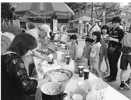
恒例のかき氷とポップコーンも人気

11時頃、支部か ら上棟式の準備の ため他分会の仲間 が来てくれました た。上棟の建て方 に来場客が興味深 く見ていました。 午後1時に上棟式 が始まり、棟の上 から撒かれるお菓子に子 どもたちが群がりとても 楽しんでいました。午後 3時過ぎ、片付けもスム ーズに終わり他分会の仲 間も交えての打上ではお 互いの労をねぎらいまし た。