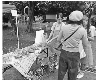
ママ友のワークショップ

者と何度も「ハイタッチ」を繰り返していました。ある母親からは「わが子の新たな成長、今まで見たこともない笑顔をみせてもらいました」と感謝の言葉もいただきました。小学生の女の子2人が出来上がったフランクスターを得意げに掲げている姿に物づくりの大切さを改めて感じました。総合受付はてんでこまいの忙しさに嬉しい悲鳴、包丁研ぎも大好評で地域のみなさんからも感謝されました。今回は包丁研ぎや木工教室の指導員