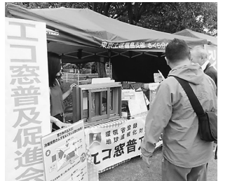
フリーマーケットも好評