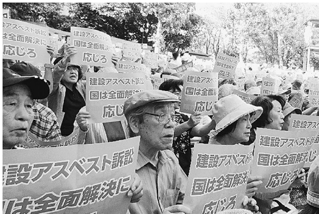
日比谷野音に2762人が参加

国と企業は判決に従わず上告して、命あるうちの解決を望んでいる原告と向き合っていない。命あるうちの解決を望んでいる原告と向き合っていない。命あるうちの解決を望んでいる原告と向き合っていない。