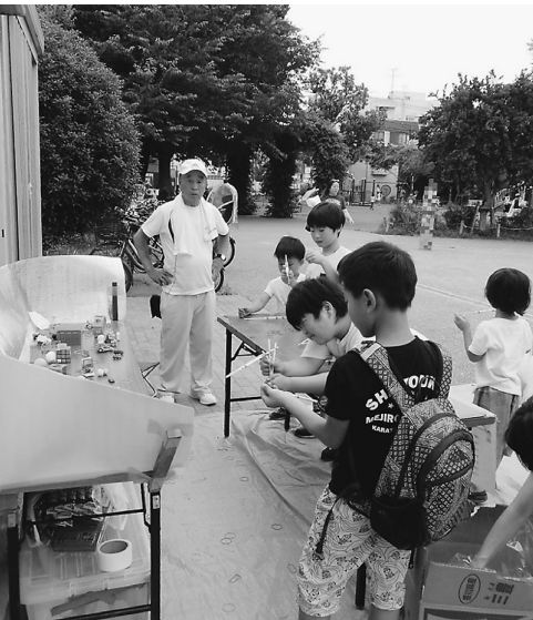
大人気だった輪ゴム鉄砲