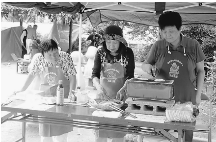
好評の焼きせんべい