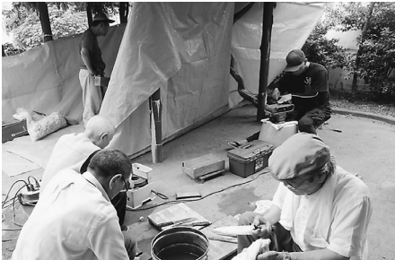
包丁研ぎは大忙し