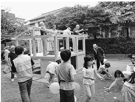
上棟式でのお菓子まき