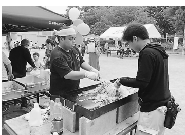
フランクと焼きそばは盛況

6月2日に開催された 第42回住宅デーは組合員 の奮闘もあり、素晴らしい ものになりました。椎 名町分会では事前に分会 実行委員会を2回開催し て、それぞれの持ち場や 買い出しの準備、当日の 流れを確認しているの で、スムーズに当日を迎 えることができました。 当日は暑くもなく、開 始時間をむかえると家族 連れや地元の方などで賑 わいました。 今年の特徴はなんとい っても包丁研ぎが大盛況 だったことです。3人の 職人さんがフル回転で頑 張りました。工作教室は 本立てが完売したのとは 対照的に、プランターは イマイチでした。ゲーム コーナーでは輪ゴム鉄砲 が大人気で、子どもたち が楽しそうに遊んでいま した。飲食ブースでは暑 くならなかったこともあ り、ドリンク販売とかき 氷の売り上げはまあまあ でした。