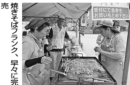
焼きそばフランク、早々に完 売

い、包丁研ぎ、 まな板削り、 木工教室では プランター、 木っ端トイな ど企画しまし た。今年度の 参加者は21人 でしたが、は